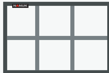
Padded Divider | Séparateurs rembourrés

C - 1" Thick Nylon Padded Divider Insert