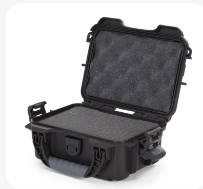
Mousse en cubes