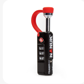
Serrure de boîtier approuvée TSA