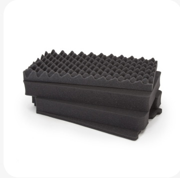
Mousse en cubes