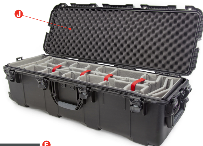
Top view assembled / Vue de dessus assemblée / Vista superior ensamblada