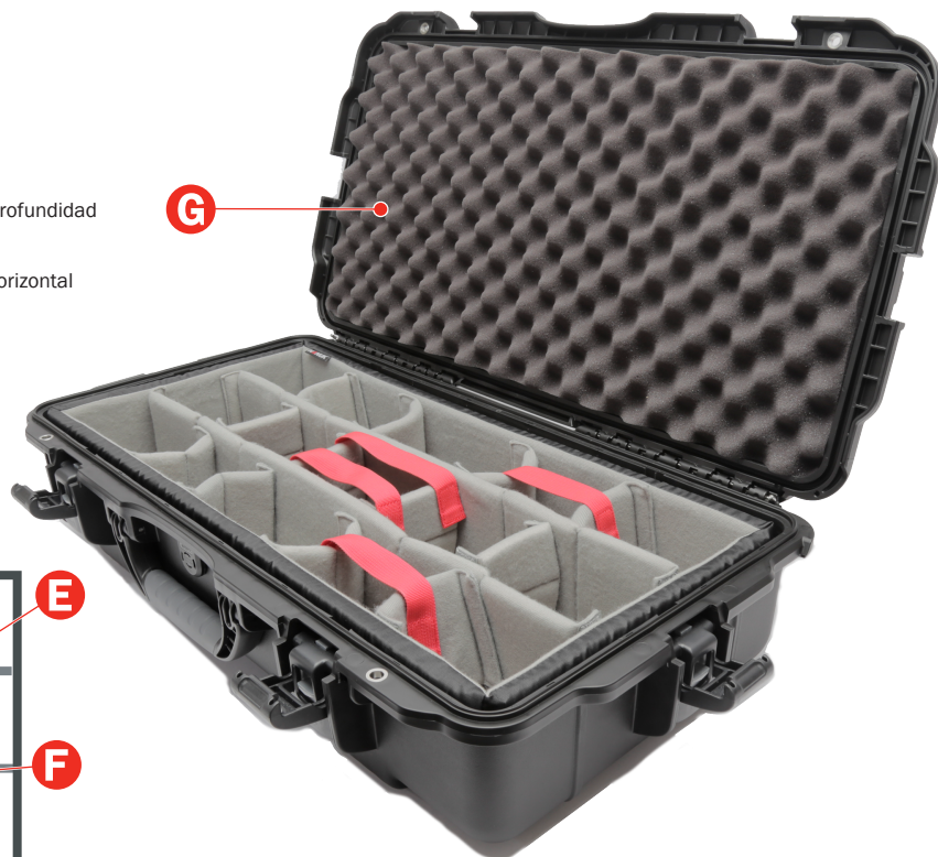
Top view assembled / Vue de dessus assemblée / Vista superior ensamblada